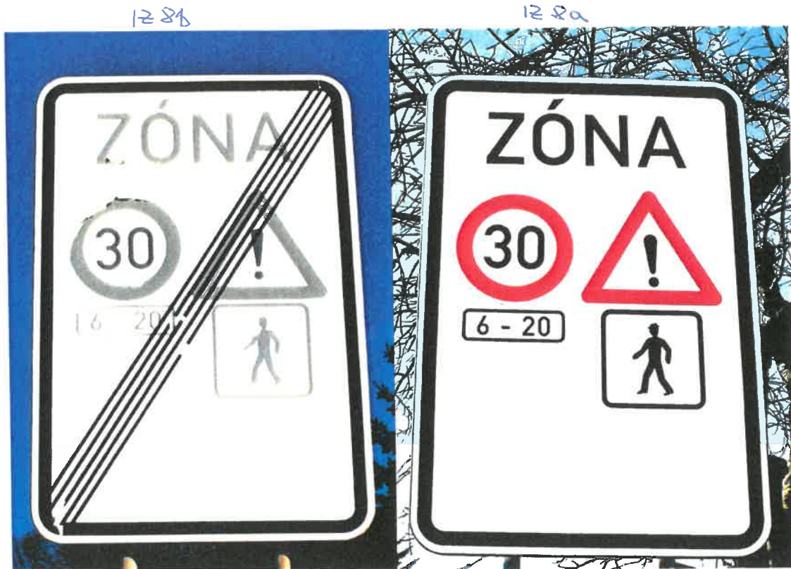
Odinstalování dopravních značek IZ 8a a IZ 8b na silnici III. třídy v celé obci Libčany.