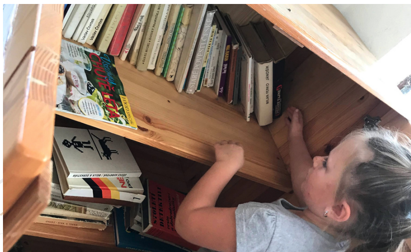
MŠ Třesovice - píše o veřejně dostupnou knihovnu

"Nejprve jsme zahájili nový školní rok přivítáním nových dětí, průběžně slavíme s dětmi jejich narozeniny i svátek, 16.9. se u nás uskutečnil naučný program s názvem Vesmírná show, kde se děti ve velkém nafukovacím stanu seznámily se Sluneční soustavou, historií kosmonautiky a shlédly pohádku Zvířátka a planeta Země. V posledním zářijovém týdnu jsme v Dobřenicích slavili posvícení - děti pekly koláče, zahrály si Pověst o čápoři, která se váže k historii Dobřenic a oslavu jsme zakončili posvícenskou tancovačkou.