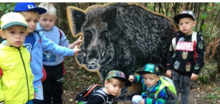
Lesní pedagogika v hradeckých lesích

O prázdninách jsme pořádali aktivity pro děti - storytelling v knihovnách, finanční gramotnost hravě, letní angličtinu a učení o klimatických změnách. Od konce srpna probíhají školení pro celé sborovny na témata Práce s chybou a Trídnické hodiny. Na obě témata jsou ze strany pedagogů pozitivní zpětné odezvy. Další sborovny budou proškoleny ještě během podzimu. Mateřinkám jsme zajistili program na Naučné stezce v Hoříněvsi a v hradeckých lesích. Říjen se ponese ve znamení workshopů na téma Matematický software a jeho aplikace ve výuce, Úprava fotografií v prostředí volně dostupného SW, Paměťové techniky a jejich využití ve výuce. O tyto témata projeví velký zájem sami pedagogové a akce budou probíhat online formou. Více informací na našem FB - @MAPIIORPHK .