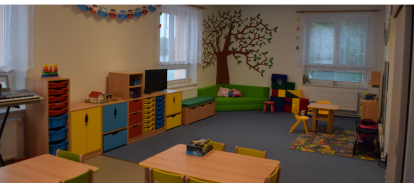
MŠ Libčany - nová přístavba a třída