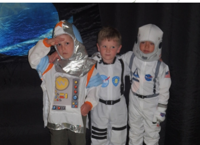
MŠ Dobřenice - Vesmírná show