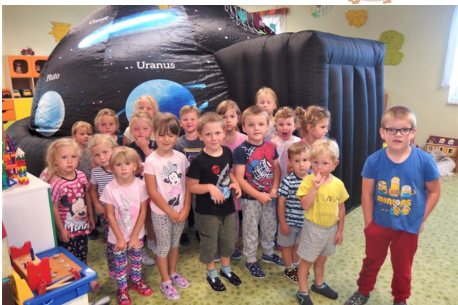
MŠ Dobřenice - Vesmírná show