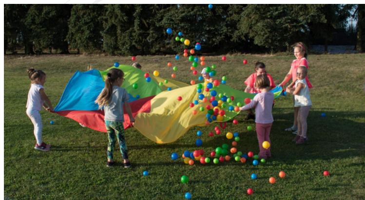
"Předškoláci a pohyb" - Podpora komunitní práce v Hněvčevsi

Třetí vydání patří Fichi č. 3 Sociální integrace v rámci které bude vybudováno nové Komunitní centrum v obci Hněvčeves. Zde již probíhá projekt Podpora komunitní práce v Hněvčevsi.