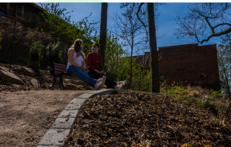
Tovární park v Libčanech