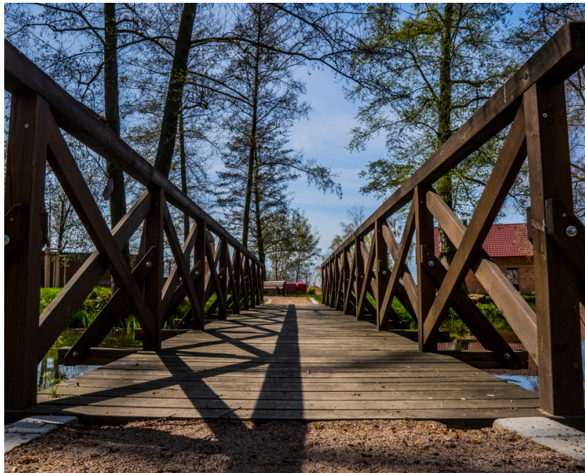
Tovární park v Libčanech

připravili jsme pro Vás třetí zpravodaj v letošním roce. Nemohu jinak, než vzpomenout na předchozí číslo, ve kterém jsme se těšili z ukončeného nouzového stavu. Užili jsme si krásné dny a načerpali jsme pozitivní energii ze slunce. Léto ale rychle uteklo a my jsme se přehoupli do podzimu. Bohužel situace spojená s Covid - 19 se znovu zhoršuje. Pevně věřím, že opatření, která se postupně přijímají, nebudou mít vliv na naši spolupráci s žadateli či příjemci dotací. V současné době náš Výběrový orgán hodnotil projekty v 9. a 10. výzvě IROP a Programový výbor projekty schválil k financování. Žadatelé jsou tak před realizací svých projektů a bylo by velmi nepříjemné, kdyby nemohli své projekty uskutečňovat včas.