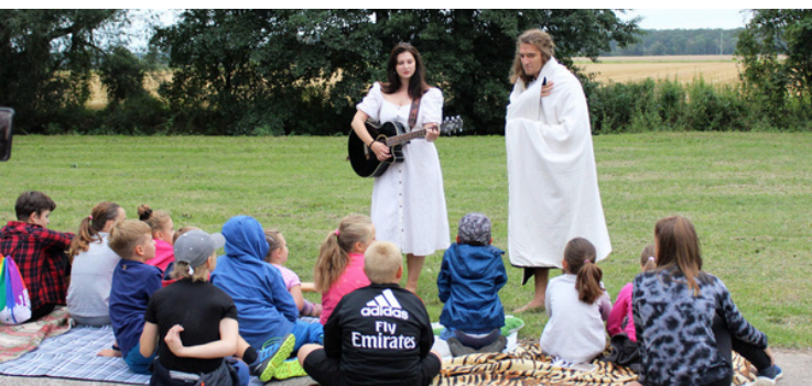
Storytelling pro děti v Hoříněvsi