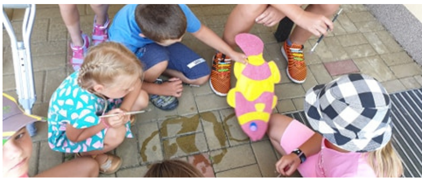
Učení o klimatických změnách - "Kam se poděl náš rybník?"