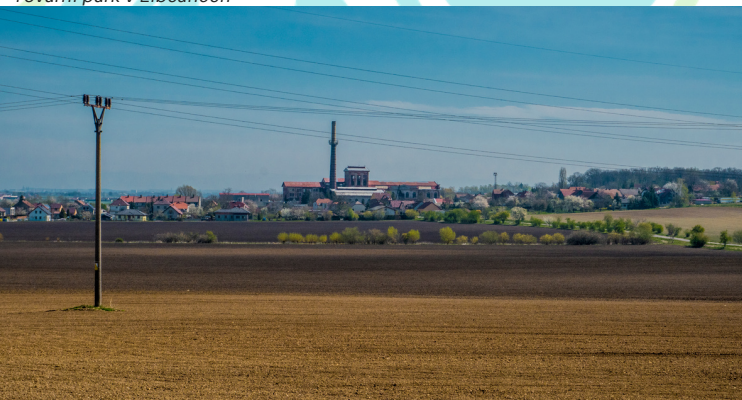
Pohled na obec Syrávká

Pomalu končí programové období 2014 - 2020 a přípravy na nové období jsou v plné realizaci. Máme splněný první úkol, kterým bylo podání žádosti o ověření Standardů MAS. S podáním této žádosti byl spojený přechod na nové webové stránky, na které se můžete podívat zde . Nyní zpracováváme novou Strategii pro nadcházející období 2021 - 2027 a protože je to klíčový dokument pro rozvoj území, potřebujeme znát, co nám na našem území nejvíce chybí a co nejvíce postrádají naši občané.